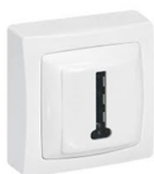
Prise téléphonique ACTUELLE

Afin d'anticiper la disparition de votre ancienne ligne téléphonique, contactez un opérateur qui effectuera gratuitement le raccordement de votre logement à la fibre pour assurer la continuité de vos services actuels : n'attendez pas la dernière minute au risque d'être facturé.