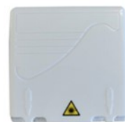
Prise fibre À INSTALLER PAR L'OPÉRATEUR DE VOTRE CHOIX

L'installation de la prise est réalisée à l'emplacement de votre choix. Pour cela il vous faut contacter votre opérateur actuel ou un opérateur fibre .